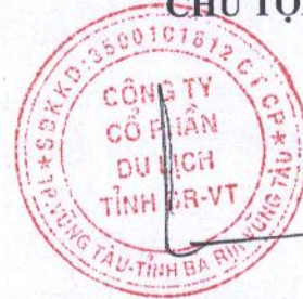
TRẦN TUẤN VIỆT